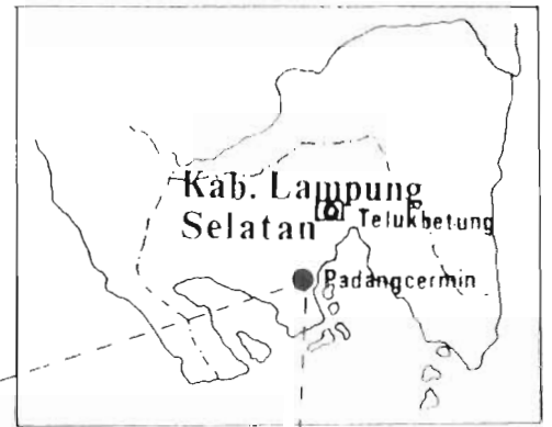
Gambar 1. PETA LOKASI PENANGKAPAN NYAMUK DI KECAMATAN PADANG CERMIN, KABUPATEN LAMPUNG SELATAN